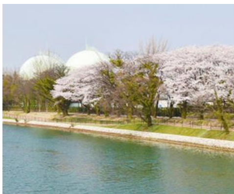
富岩水上ラインから見える球形ホルダー

https://www.creema-springs.jp/projects/enlight2021